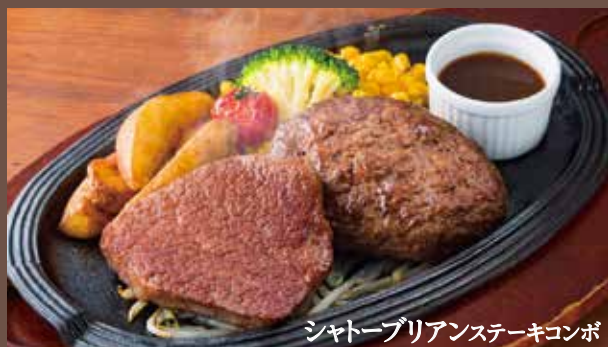
シャトーブリアンステーキコンボ