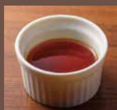
自家製おろしポン酢