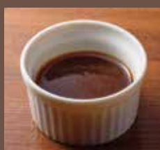
矢澤オリジナルソース